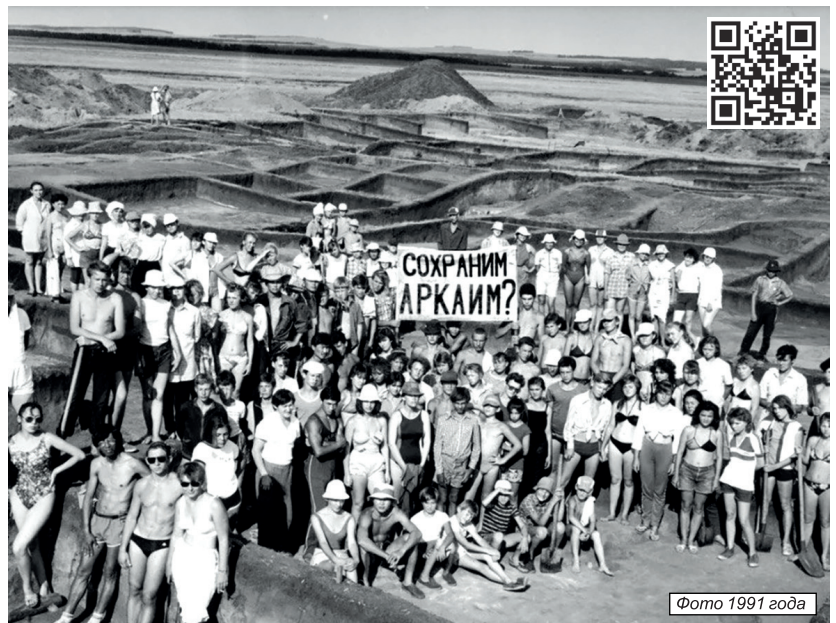
Фото 1991 года

Эти сочинения содержат учение основателя религии Зороастризма. В них описываются жизнь и реальные события в эпоху ранней бронзы, как минимум 2800 лет до нашей эры, когда процветал Аркаим и соседние с ним поселения.